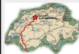
Gestartet wurde in Langenthal. In zehn Monaten ist die Ankunft in Südafrika geplant.